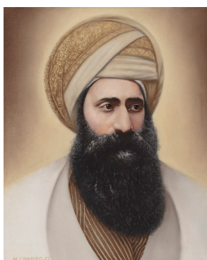
рабейну Йосиф Хаим (Бен Иш Хай)

Данная "синяя" часть "Алгебры сигнатур" (Алсигны) является "переизложением" (т.е. переводом и изложением) книги " Даат ве Твуна " (Знание и Понимание) одного из величайших еврейских мудрецов конца 19-го и начала 20-го веков, главного раввина Багдада Йосефа Хаима (1832 - 1909), более известного под именем \text{בן ישׁי חַיִּי} ( Бен Иш Хай - Сын Человека Жизни).